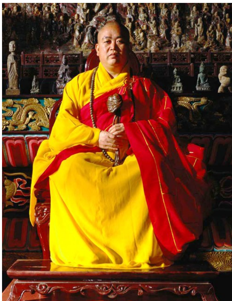
Przeor klasztoru Shaolin mnich Shi Yong Xin.

Na proces nauczania tradycyjnego Shaolin kungfu składają się więc nie tylko techniki walki, lecz wplatają się w niego również historycznie ukształtowane przez mnichów świątyni Shaolin i obowiązujące po dzień dzisiejszy zasady postępowania, oparte o patriarchalny model rodzinnych więzi i powinności, religia, system wartości oraz filozofia życiowa. Wszystkie one są z sobą stopione w jedną nierozzerwalną i spójną całość. Kultuwując dziedzictwo klasztoru Shaolin należy je przyjąć w całości, niczym spadek „z całym dobrodziejstwem inwentarza”, dziedzicząc go wraz ze wszystkimi częściami składowymi lub go w całości odrzucić, nie otrzymując wówczas nic.