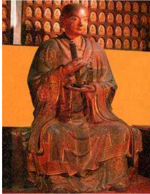
Fot. 13. Na terenie świątyni znajdują się wspaniałe posągi osiemnastu luohanów