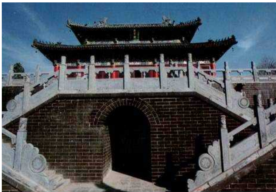
Fot. 4. Wejście do Sali Tajemnych Broni w Świątyni Białego Konia

Świątynię Białego Konia określa się również zaszczytnym mianem „Ziemskiego Sukhawati” (Sukhawati to tzw. Czysta Kraina Buddy Amitabhy). Na jej terenie znajduje się siedem wielkich sal modlitewnych, poświęconych różnym buddyjskim bóstwom, m. in. Strażnikom Niebios (Tian Wang Dian). Ozdobą świątyni jest wielka trzynastopiętrowa ceglana pagoda. Na okolicznych polach wznoszą się pozostałości ceglanych murów otaczających niegdyś miasto Luoyang, wybudowanych w okresie dynastii Han.