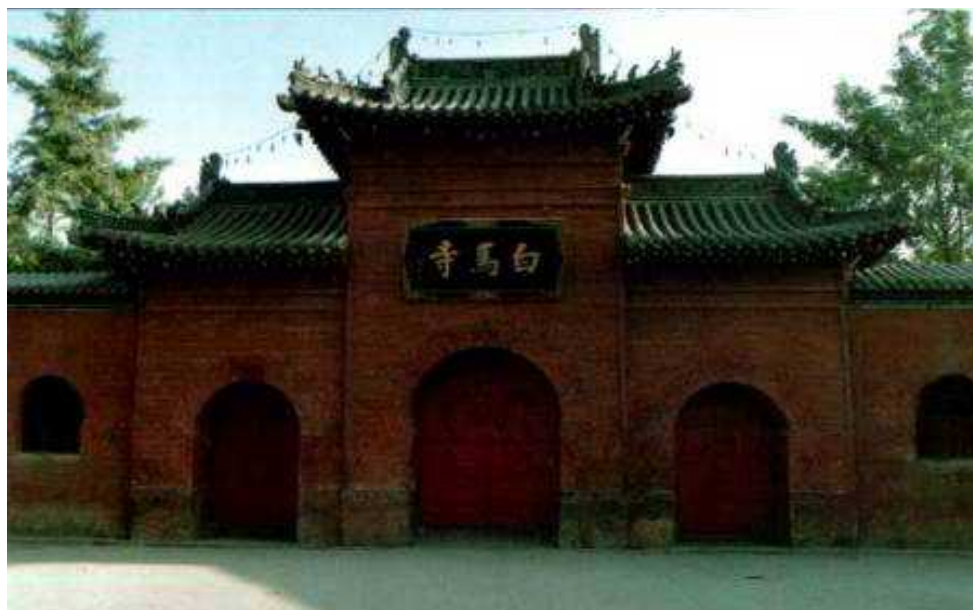
Fot. 1. Główna brama Świątyni Białego Konia

Przebywając w 1998 roku na seminarium treningowym kung-fu w klasztorze Shaolin, odwiedziliśmy wiele położonych w okolicy sakralnych miejsc. Jednym z nich była słynna Świątynia Białego Konia.