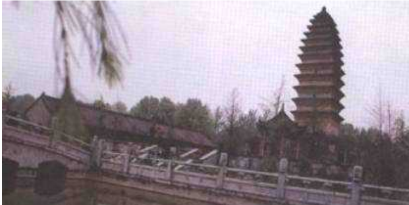
Fot. 9. Fragment świątyni z ceglana trzynastopiętrową pagodą

Świątynny ogród porastają wyniosłe wiekowe drzewa, dźwięki wielkich dzwonów rozbrzmiewają tu codziennie przez okrągły rok, a zapach tłących się powoli aromatycznych kadzideł wnosi nastrój naturalnego spokoju i ukojenia.