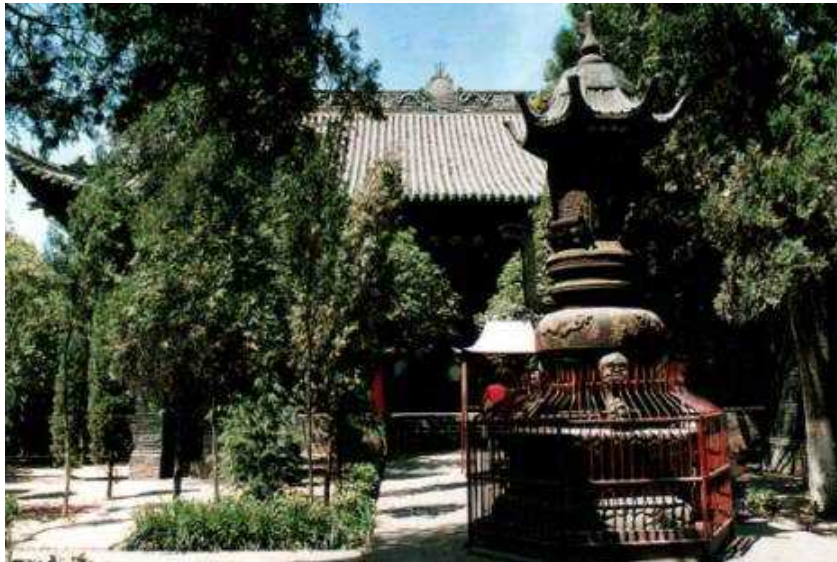
Fot. 10. Fragment ogrodu przed Pawilonem Buddy

Świątynny ogród porastają wyniosłe wiekowe drzewa, dźwięki wielkich dzwonów rozbrzmiewają tu codziennie przez okrągły rok, a zapach tłących się powoli aromatycznych kadzideł wnosi nastrój naturalnego spokoju i ukojenia.