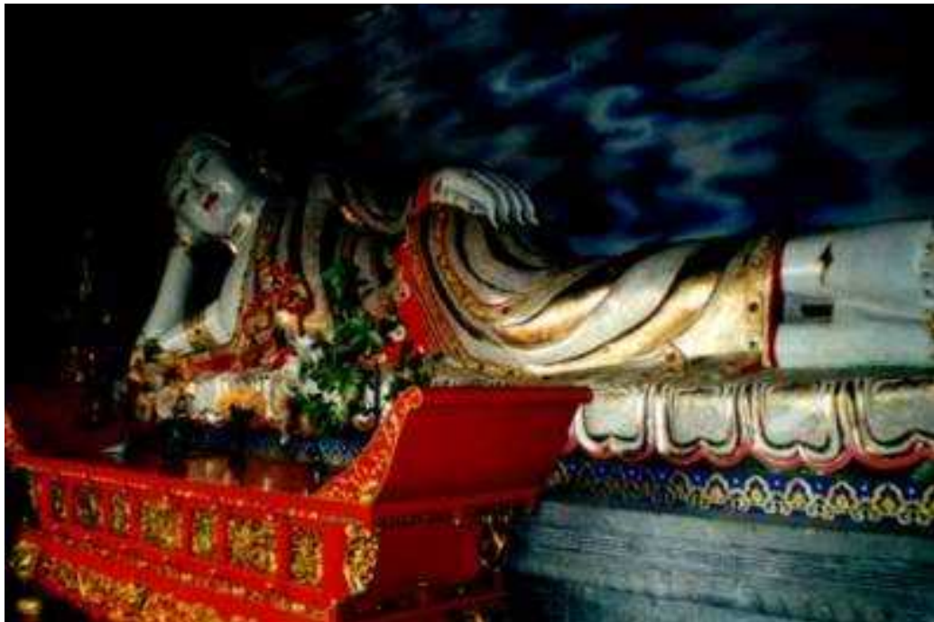
Fot. 18. Posąg leżącego Buddy

Fot. 16. Malowidło pt. „Księżyc ukazujący się pomiędzy górami nad świątynią Fawang” Fot. 17. Jeden ze świątynnych obrazów