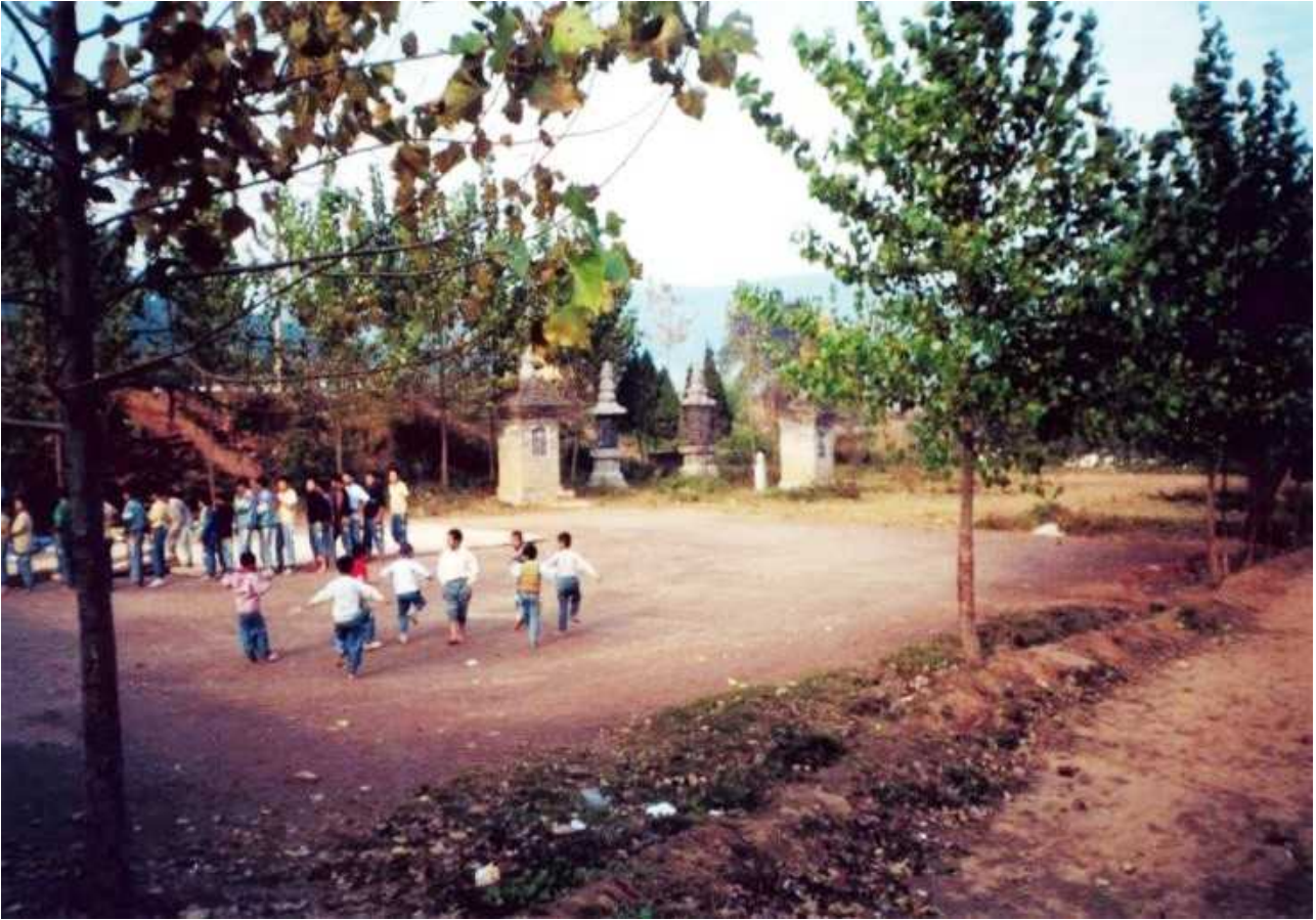
Fot. 10. Zdjęcie z 2000 roku przedstawiające plac treningowy, na granicy którego widoczne są powyższe pagody