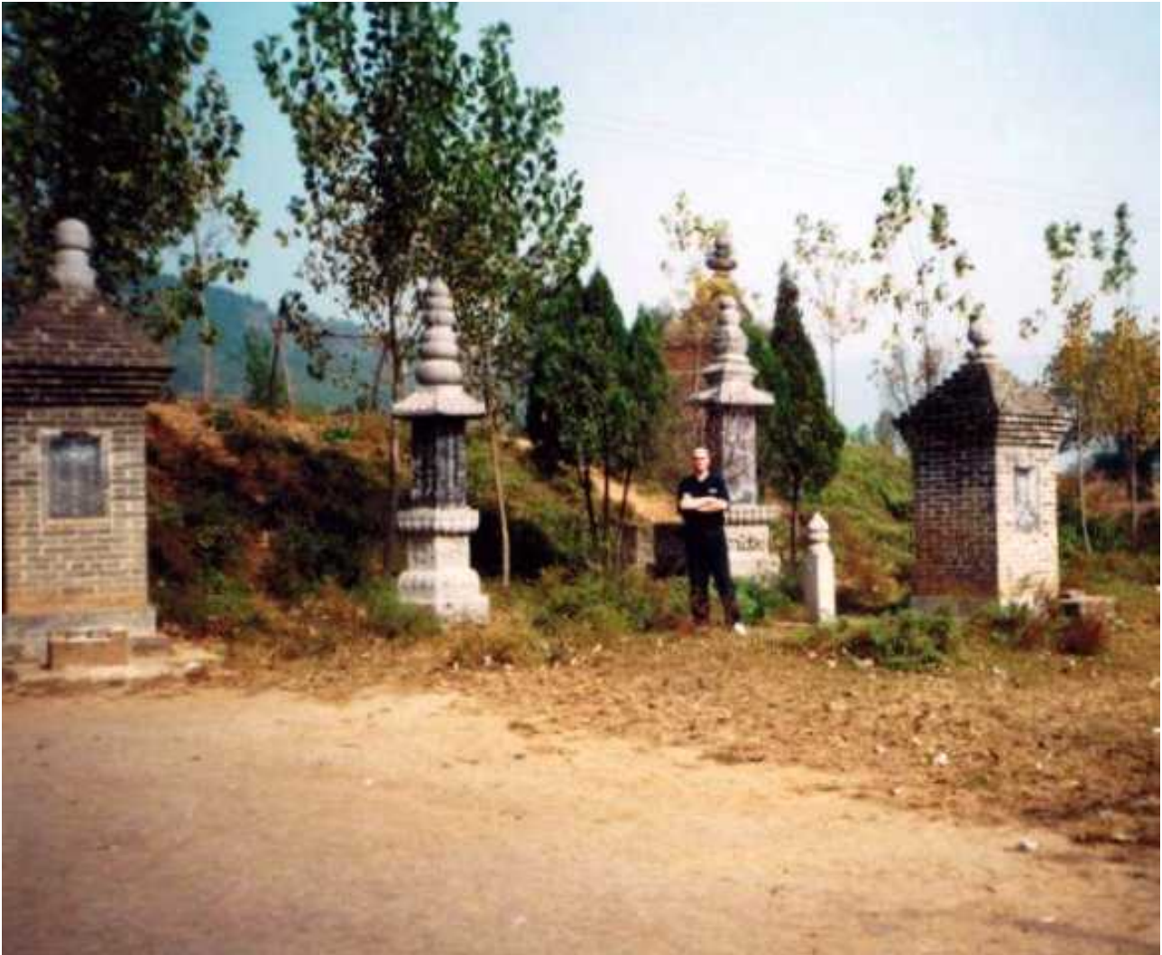
Fot. 9. Autor artykułu w 2000 roku na tle pagód wznoszących się na granicy placu treningowego szkoły kung-fu prowadzonej wówczas przez mistrza Shi De Yanga

Z przykrością stwierdzam, że widoczna na powyższym zdjęciu: