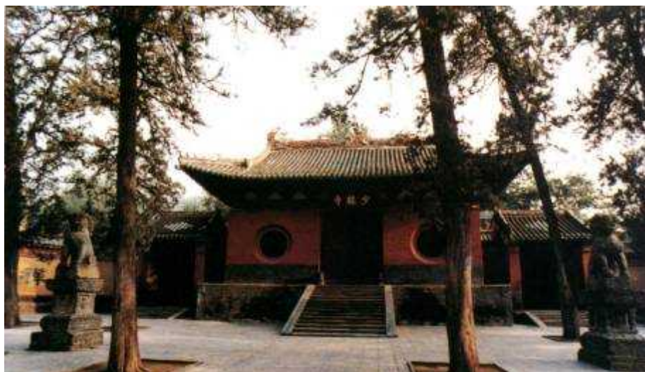
Fot. 2. Główna brama klasztoru Shaolin

W 496 roku cesarz Xiaowendi z Północnej dynastii Wei nakazał zbudowanie u podnóża góry Song klasztoru Shaolin dla hinduskiego mnicha Batuo, zwolennika samowyzwolenia od cierpienia według buddyjskiej doktryny Małego Wozu, by tam mógł on wygłaszać kazania i odbywać praktyki religijne. W 527 roku kolejny hinduski mnich Bodhidharma przybył do klasztoru Shaolin, by tam rozpowszechnić szkołę Wielkiego Wozu buddyzmu, z praktyką głębokiej medytacji w pozycji siedzącej, utrzymując i postrzegając umysł jako spokojny i naturalny niczym ściana. Za sprawą jego osoby oraz jego następców powstała i rozwinięta została sztuka walki Shaolin Kung Fu. Z biegiem czasu sam Bodhidharma został uznany przez swoich zwolenników za twórcę buddyzmu chan (zen), a klasztor rozwinął się i stał się sławny na terenie całych Chin.