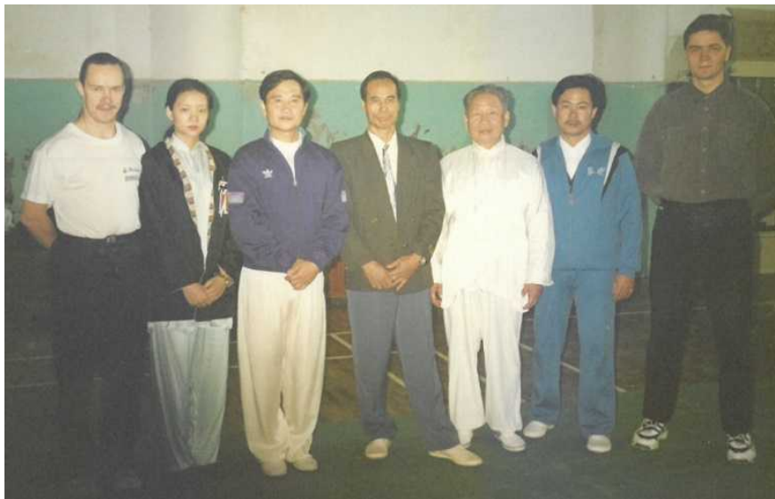
Fot. 27. Zdjęcie grupowe w Fuzhou