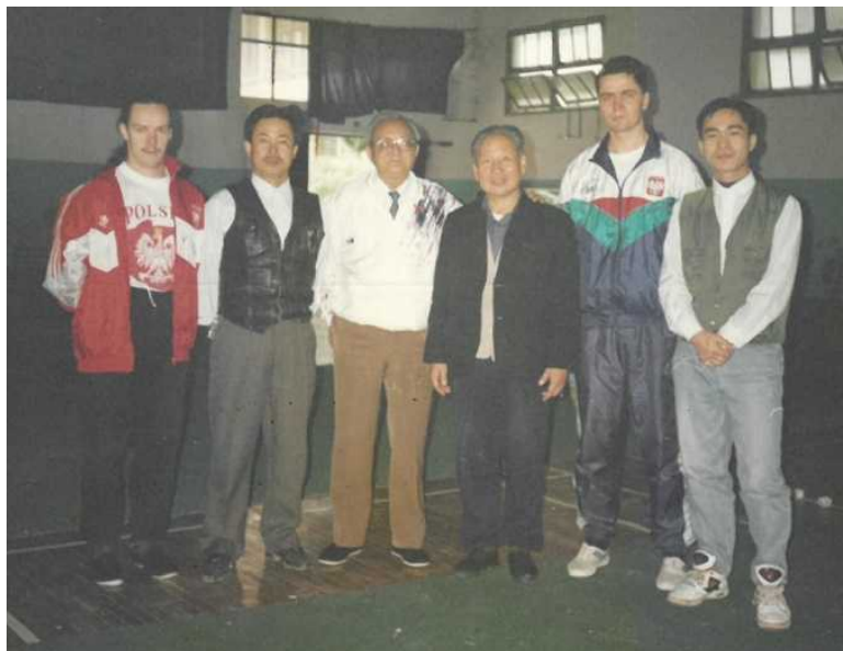
Fot. 25. Grupowe zdjęcie w Fuzhou