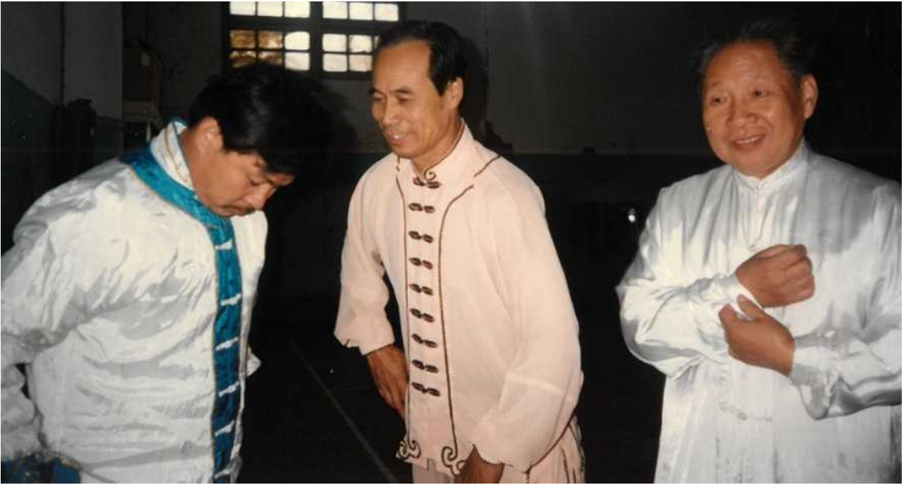
Fot. 22. Trzej mistrzowie południowochińskich sztuk walki z miasta Fuzhou