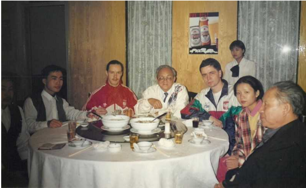
Fot. 19. Uroczysty obiad w Fuzhou z okazji rozpoczęcia seminarium wushu