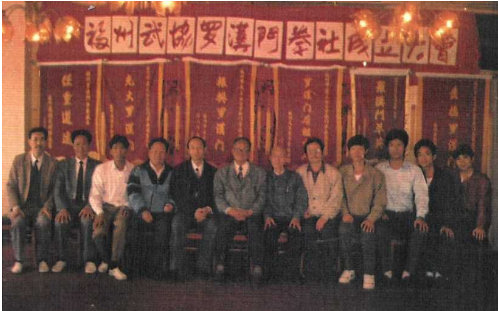
Fot. 24. Zdjęcie mistrzów oraz członków zarządu Stowarzyszenia Sztuk Walki Miasta Fuzhou