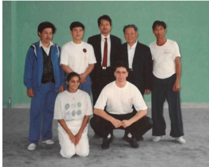
Fot. 26. Grupowe zdjęcie w Fuzhou po jednym z treningów kung-fu